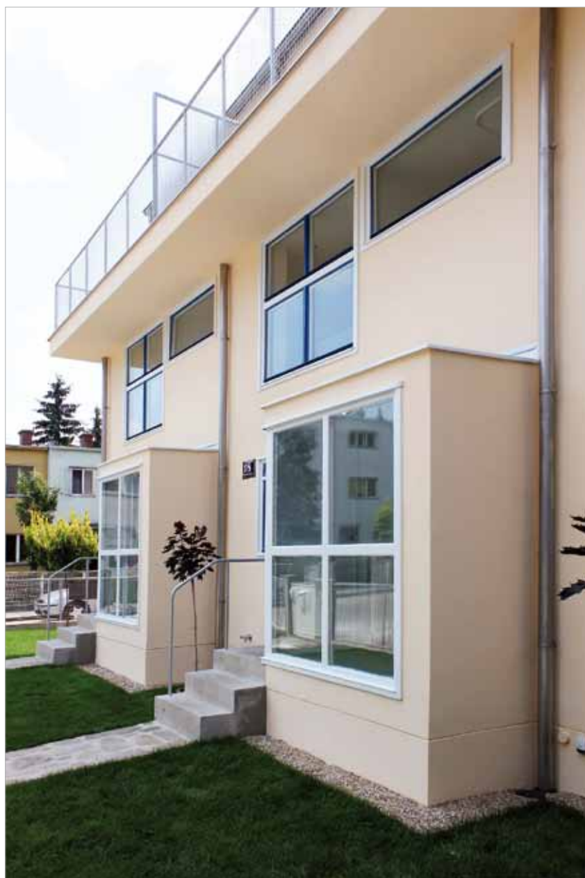
links und oben: saniertes Häuserblock Gerrit Rietveld, Woinovichgasse 14 – 20

duktion der Heizkosten um zirka 50 % ermöglicht und bei richtigem Nutzerverhalten gleichzeitig die Kondensatfreiheit der Wohnungen gewährleistet. Diese Maßnahmen umfassten vor allem die Wärmedämmung von Dächern und Terrassen mit Gefälledämmung, Wärmedämmung der erdberührten Wände, Sanierung und thermische Verbesserung der bestehenden Fenster mittels K-Glas und Silikon-dichtungen, Einbau von kontrollierten Wohnraum-Lüftungsanlagen mit Wärmerückgewinnung sowie