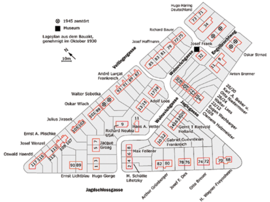
oben – Lageplan der ursprünglich 70 Einfamilienhäuser, die die Werkbundsiedlung im 13. Wiener Gemeindebau bildeten