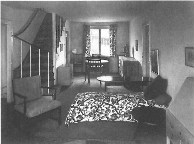
Wohnraum im Haus von Josef Frank, 1932 Josef Frank, living room, 1932