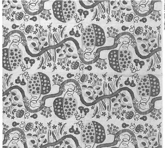
Josef Frank: Dekorstoff „Karma“, Entwurf für „Haus & Garten“ 1925–1930 Josef Frank: furnishing fabric “Karma”, 1925–1930

Werkbund Estate, erected in 1928–32 in Lainz to an overall design by Josef Frank, presented the achievements of international housing in seventy completely furnished houses and was the subject of vivid public interest that extended far beyond the boundaries of Vienna.